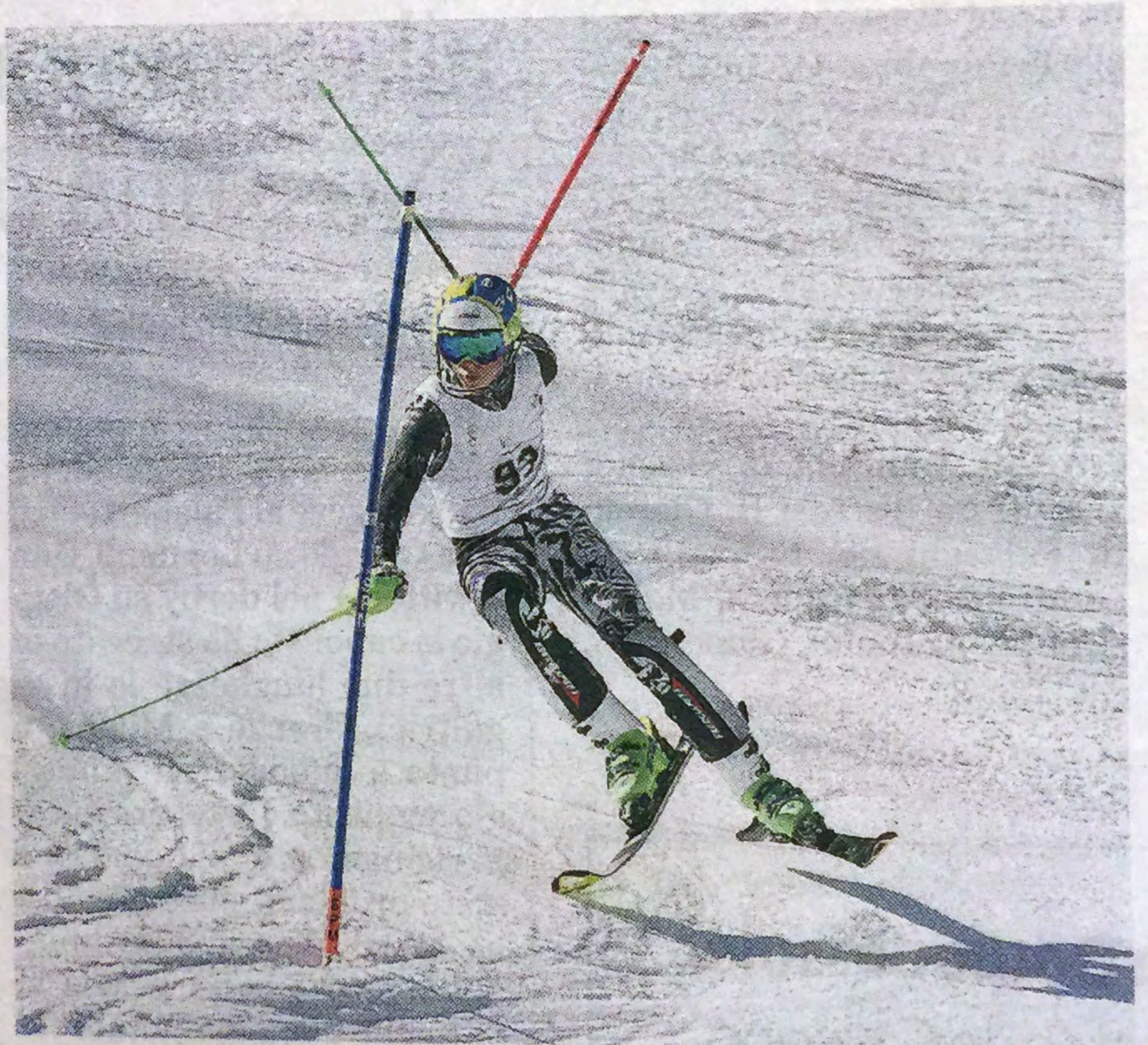
Sono stati 180 gli iscritti allo slalom che ieri ha aperto la stagione

Piazza d'onore per i padroni di casa del Formazza, terzo l'Ossola Ski Team. A coronamento del successo di squadra, per il Revolution ski race sono arrivate tre vittorie di categoria e addirittura il «triple» nella categoria Ragazzi, che comprende gli atleti di 13 e 14 anni: a dominare le due manches è stato