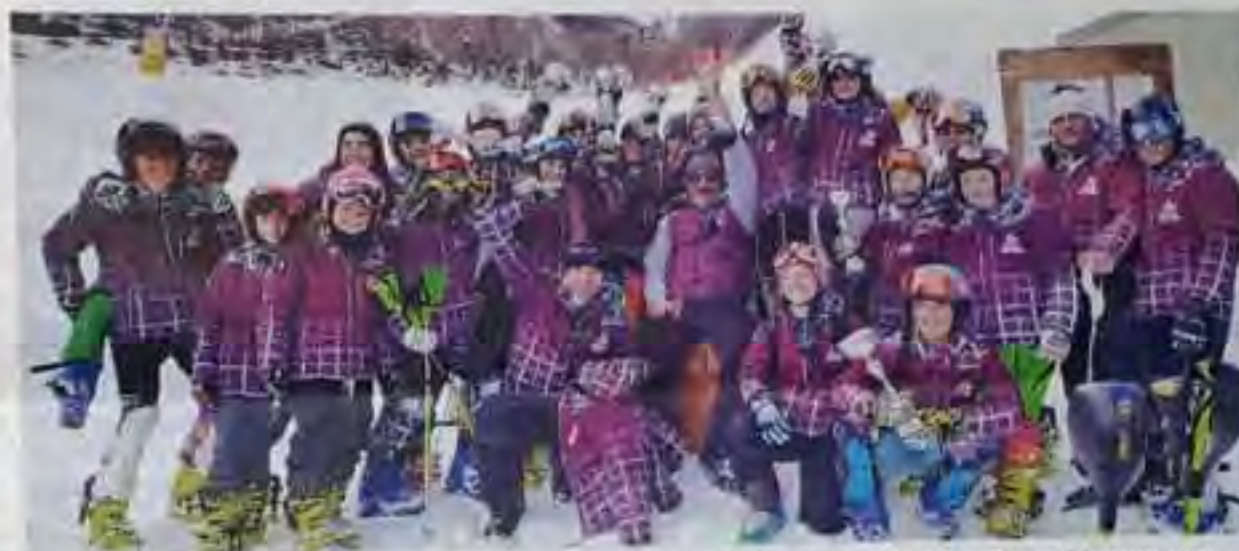
La squadra del Team Revolution Ski Race vincitrice del Trofeo Barrel disputato a Macugnaga