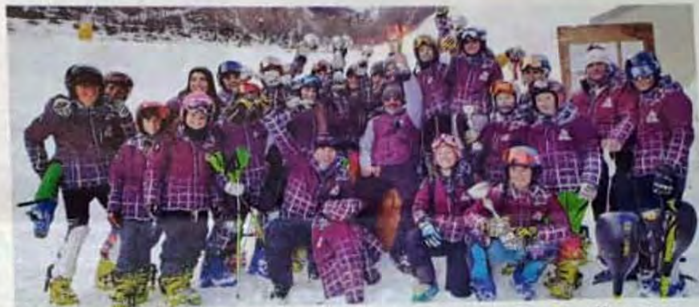
La squadra del Team Revolution Ski Race vincitrice del Trofeo Barrel disputato a Macugnaga