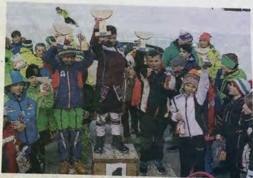
Il podio della categoria Baby del trofeo Scilligo di Formazza