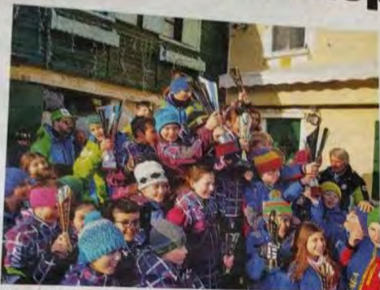
Alcuni dei giovani premiati nelle gare di Formazza e Domobianca