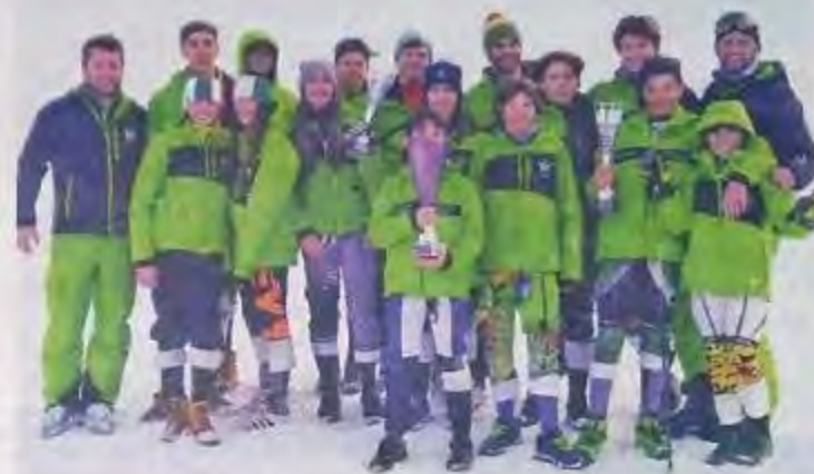
Il gruppo dell'Ossola Ski Team primo nel gigante del Devero